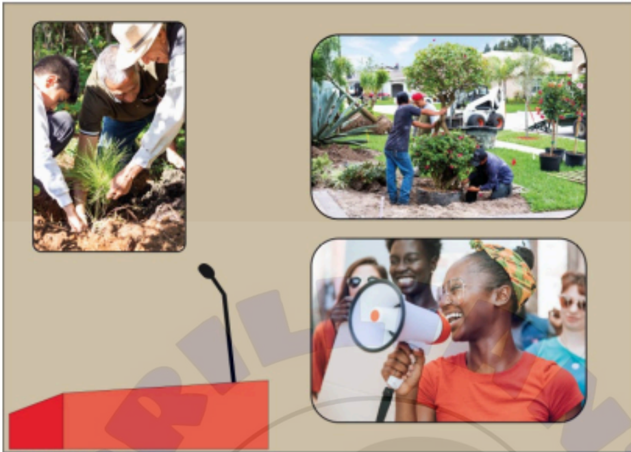
M23 LA Hindi CA Task 3 option 2.png