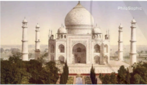
ii. M23 LA Hindi CA original.00_00_02_00.Still001.png