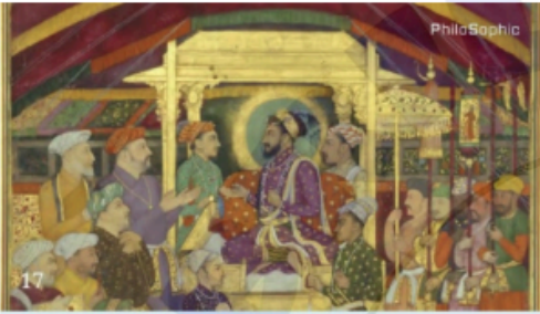
i. M23 LA Hindi CA original.00_02_20_24.Still003.png

दिए गए चित्रों का उनकी व्याख्या से उचित मिलान कीजिये।